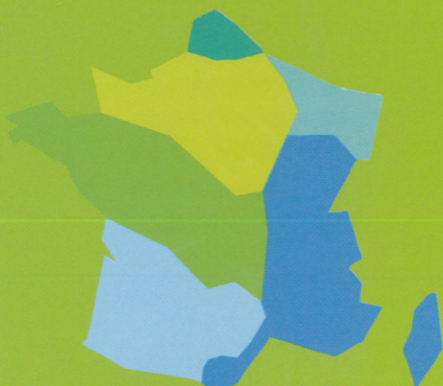
Les 7 bassins hydrographiques métropolitains

Pour reconquérir le bon état des eaux demandé par la directive cadre sur l'eau, les Agences de l'eau recherchent la meilleure efficacité environnementale,